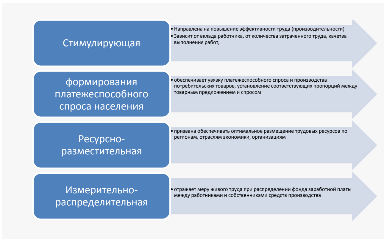
Рис. 2. Функции заработной платы

Заработная плата выполняет функции, представленные на рисунке 2.