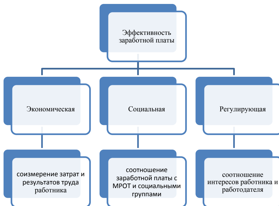
Рисунок3. Эффективность заработной платы.

Учитывая всю важность человеческого фактора в развитии производства, росте производительности труда, необходимо проводить активную политику, направленную на более полное удовлетворение запросов непосредственно трудового коллектива, поэтому стимулирующая функция заработной платы выходит на первое место.